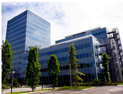
A sinistra (in foto) gli uffici di Londra. Sulla destra, invece, la sede torinese di corso Giulio Cesare